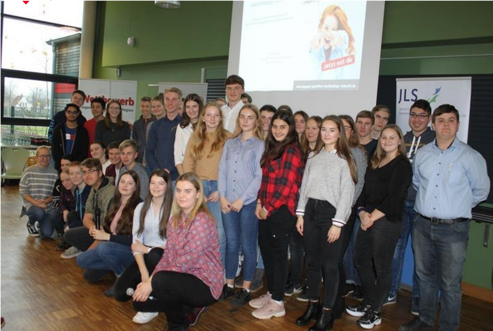
Die Schüler haben Konzepte für eine nachhaltige Region entwickelt und dabei auch das eigene Alltagsverhalten kritisch hinterfragt.